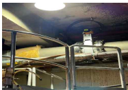
대림제이피 마산공장 Main Steam 400A 라인 FN질량유량계