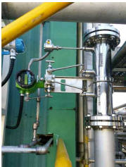
한화유신공장 Air, 100A 라인 FN질량유량계