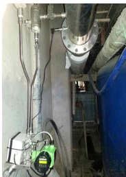
경산제지 달성공장 Main 스팀 250A 라인 FN질량유량계