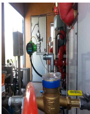
보일러 Water공급, 50A 라인 FN질량유량계