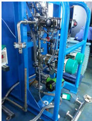
대우조선해양 선박정형수 시스템 장치 FN질량유량계