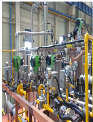
한국기계연구원 천안 LNG 50A(2), 65A(2), 80A, 100A, 125A, 150A ~ BEA FN질량유량계