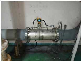
수자원공사 횡성지사 Air, 300A 막필터 교체 주기 측정용 FN질량유량계