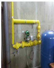
도시철도공사 Water, 50A 라인 FN질량유량계