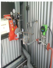
이천(잔존사체처리시스템) LPG, 25A 라인 FN질량유량계