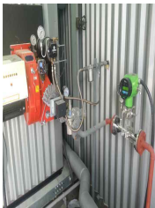
이천(잔존사체처리시스템) LPG, 25A 라인 FN질량유량계