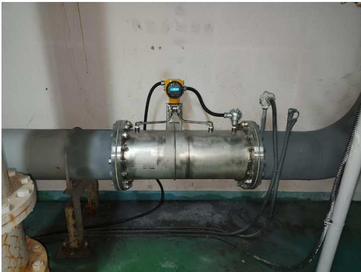
수자원공사 횡성지사 Air, 300A 막필터 교체 주기 측정용 FN질량유량계