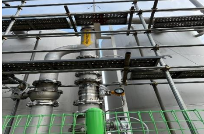
㈜극동화학 군산공장 바이오가스 거래용, 125A 라인 FN질량유량계