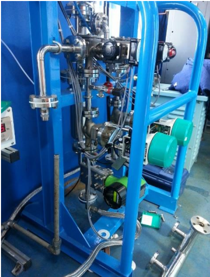
대우조선해양 선박평형수 시스템 장치 FN질량유량계