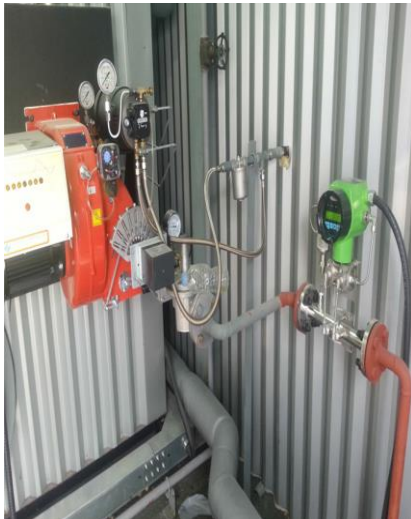
이천(잔존사체처리시스템) LPG, 25A 라인 FN질량유량계