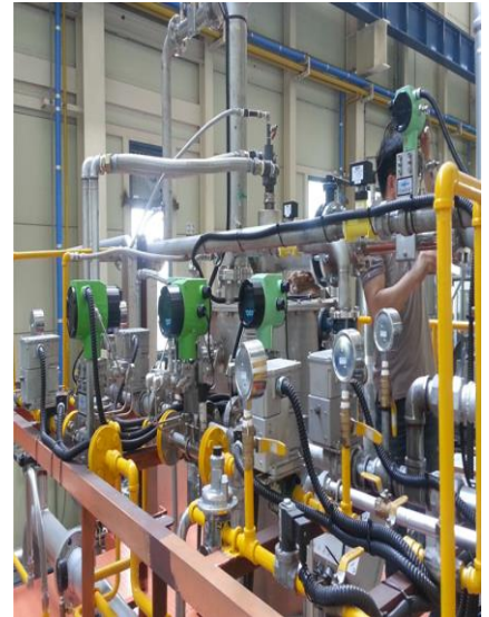
한국기계연구원 천안 LNG 50A(2), 65A(2), 80A, 100A, 125A, 150A ~ 8EA FN질량유량계