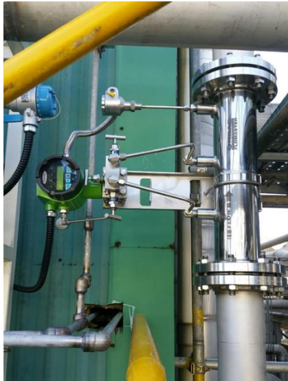
한화울산공장 Air, 100A 라인 FN질량유량계