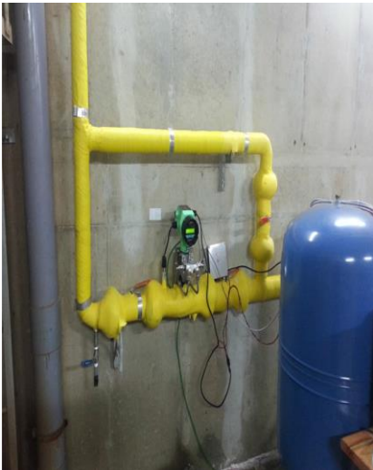
도시철도공사 Water, 50A 라인 FN질량유량계