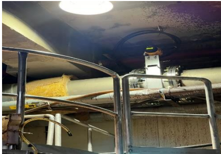
구리하수처리장 바이오가스 보일러 80A 라인 FN질량유량계