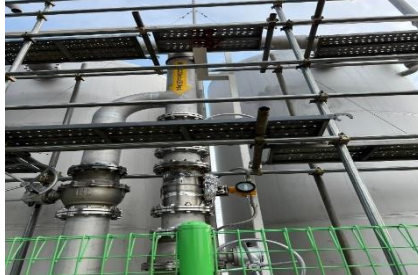
㈜극동화학 군산공장 바이오가스 거래용, 125A 라인 FN질량유량계